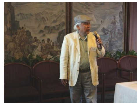
戦力分析について語る新12坂さん