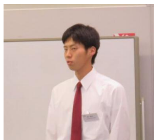
長距離を語る桂君